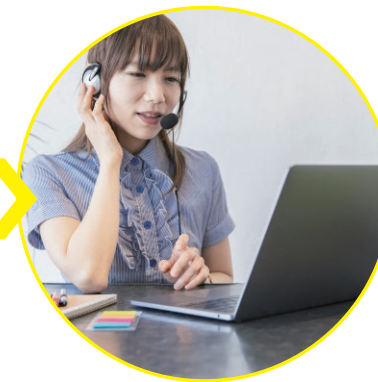
オンラインで 追跡インタビュー