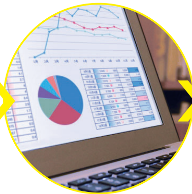
分析・ピックアップ