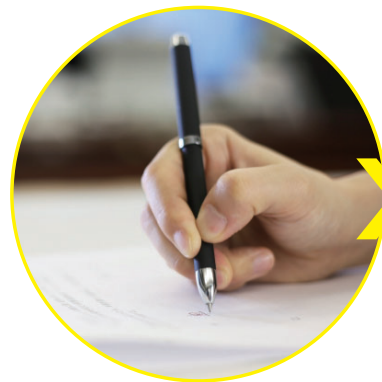
定量調査 (アンケート等)